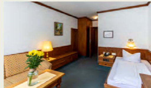
Zimmerbeispiel Standard-Zimmer: EZ, ca. 22m 2