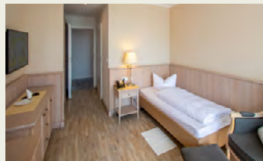
Zimmerbeispiel Klassik-plus-Zimmer: EZ, ca. 22m 2