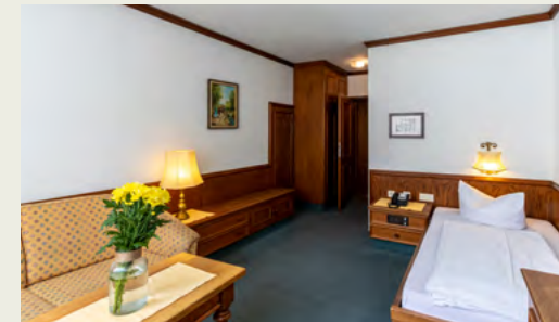
Zimmerbeispiel Standard-Zimmer: EZ, ca. 22m 2